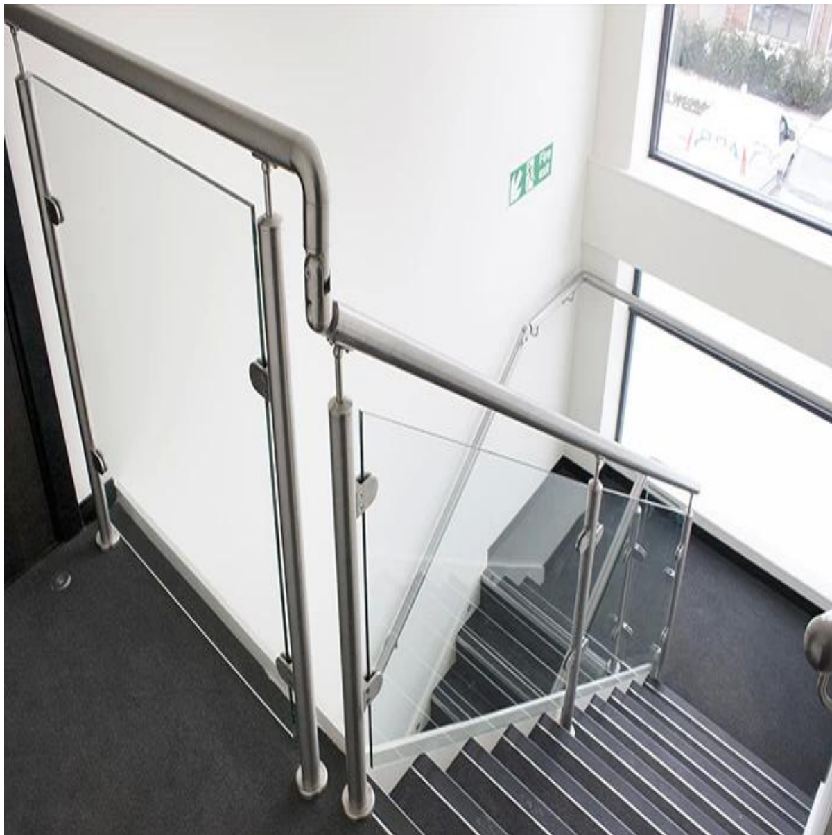
2.frameless glazen balustrade met mini bericht frameleze glazen balustrade voor balkon op Shenzhen Launch, hoge kwaliteit frameleze glazen balustrade voor balkon