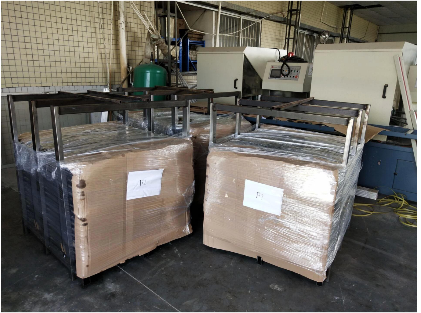
Afbeeldingen van het project