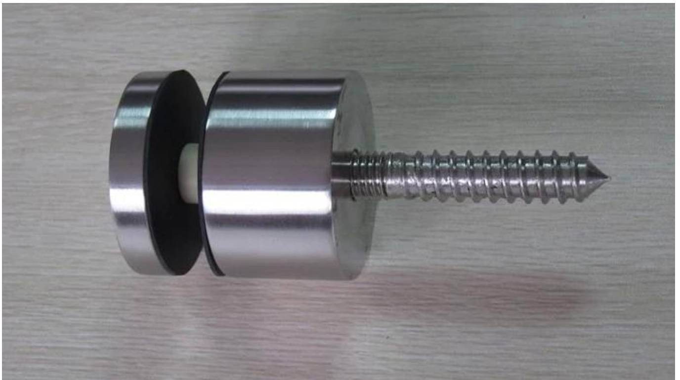
Roestvrijstalen glazen standoff in zwarte matte kleur: