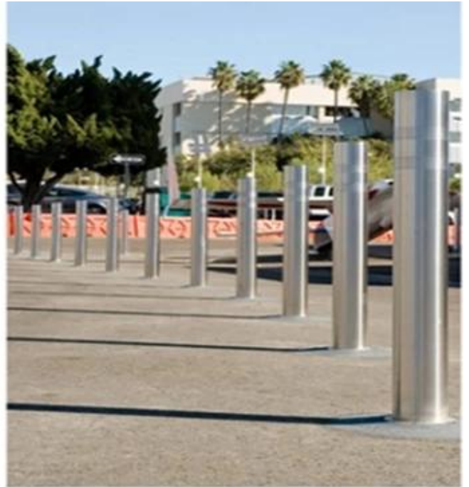
Bolders van roestvrij staalProductie