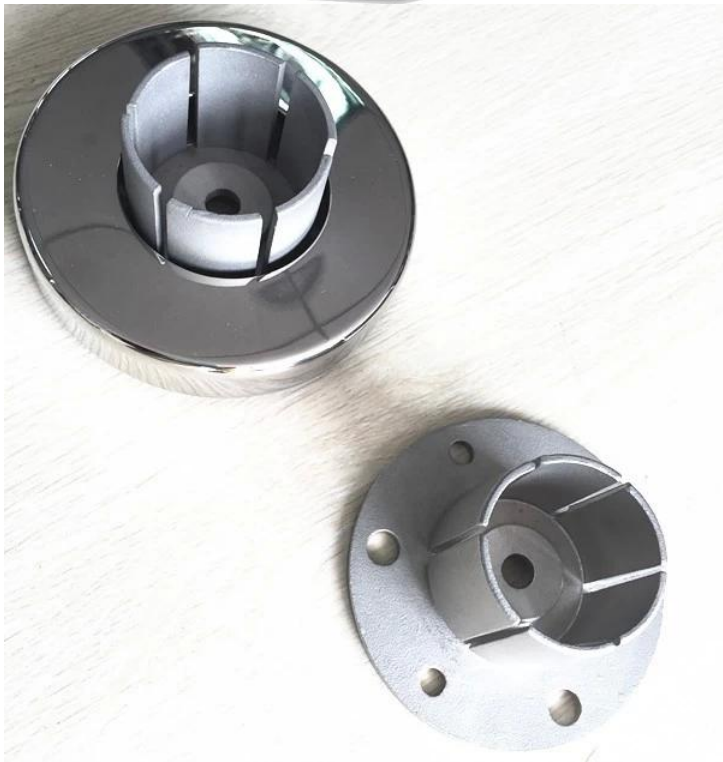
Ronde Leuning Wandflens: