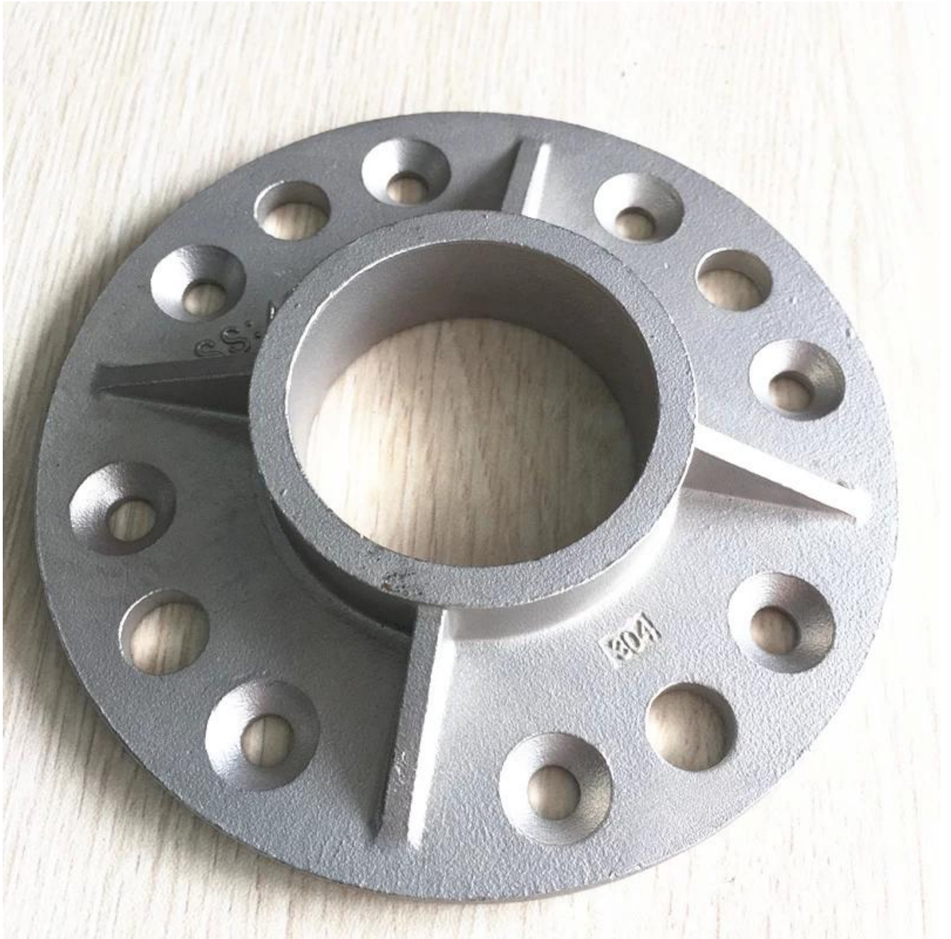
Ronde Baluster Post Fascia Mount Bracket: