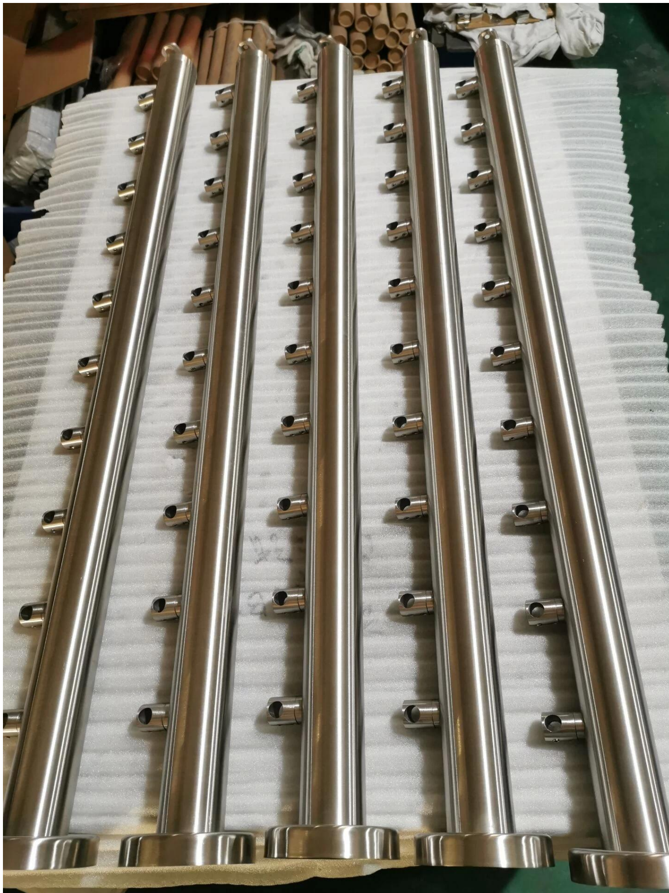
3. Specs. Voor roestvrijstalen handrailing pijp bar adapter dwarsbalkhouder