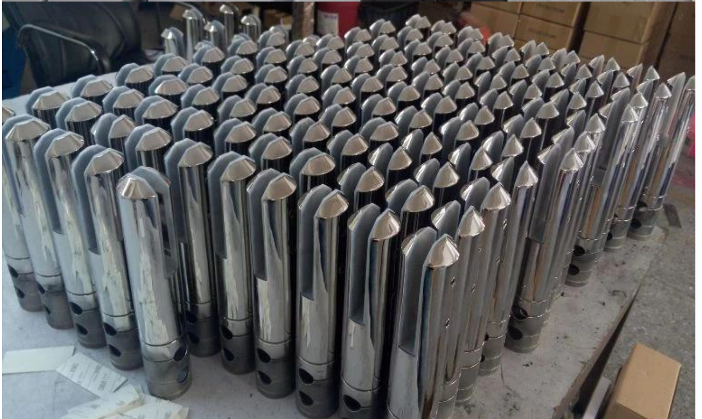
Glass Pool Fence Spigot Veiligheidsverpakking