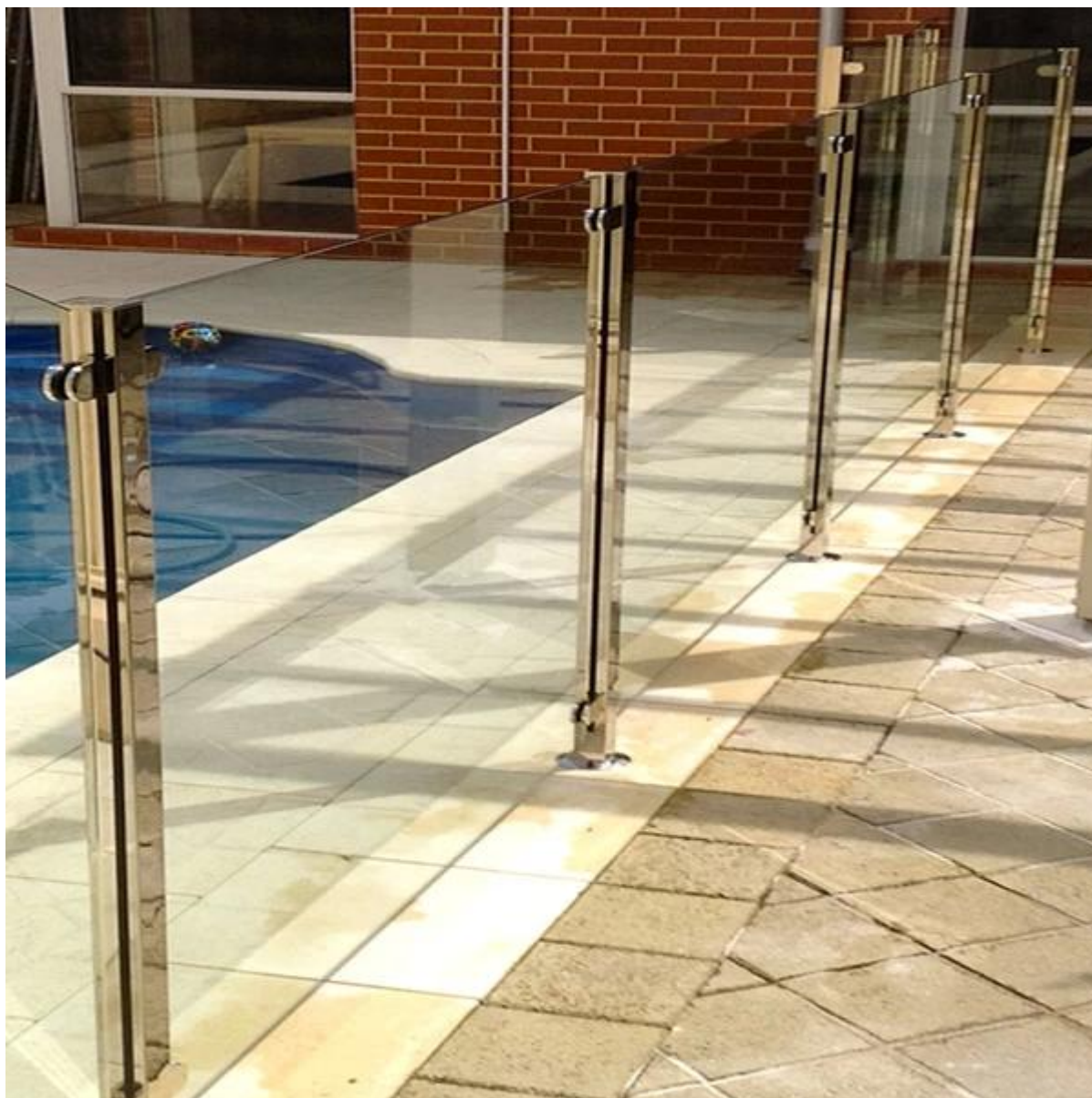
roestvrij staal glas impasse te balkon reling china leverancier, frameleze glazen balustrade voor balkon fabriek van China