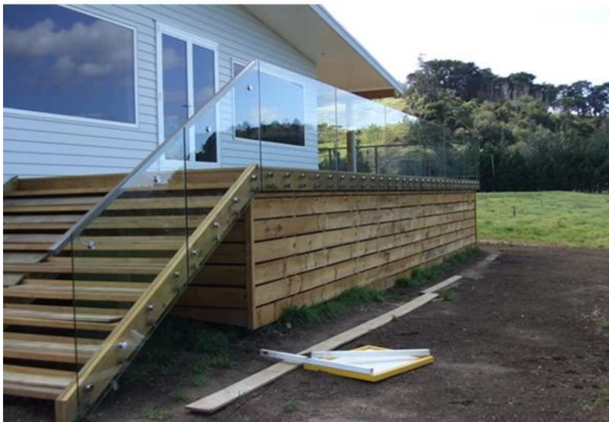
dubbel glas impasse met achterplaat