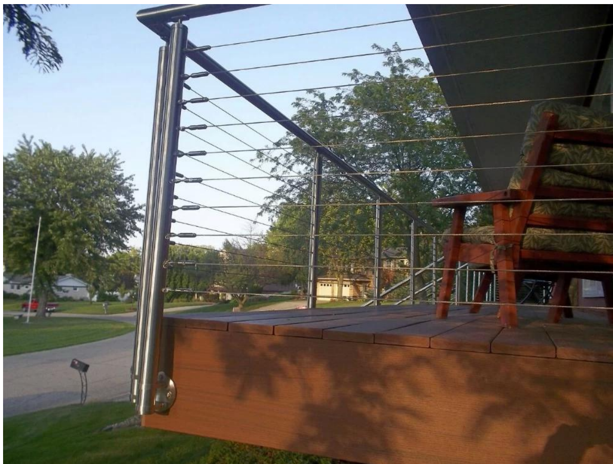
3. Vierkante vorm roestvrij staal post kabel reling project: roestvrij stalen kabel railing ontwerp voor outdoor dek,