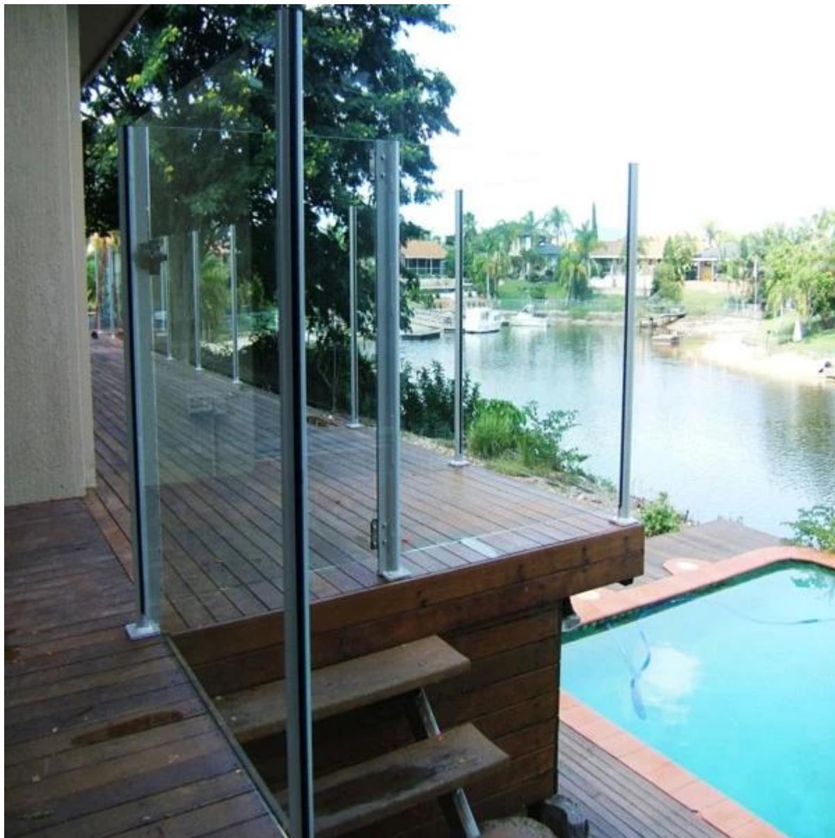
roestvrij staal glas vierkante reling post voor balkon, rvs 316 glazen balustrade post voor zwembad hek