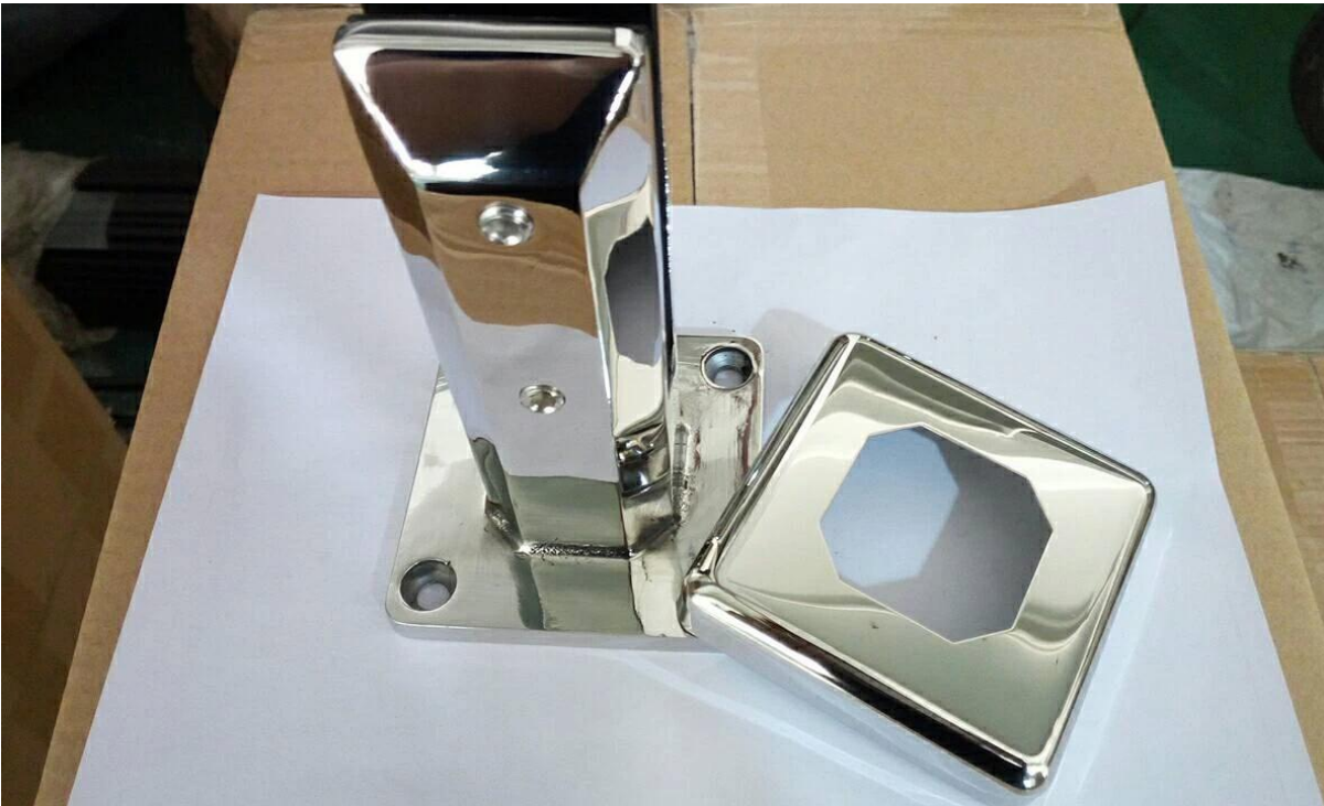
Glazen spie in geborsteld / gesatineerd afgewerkt: