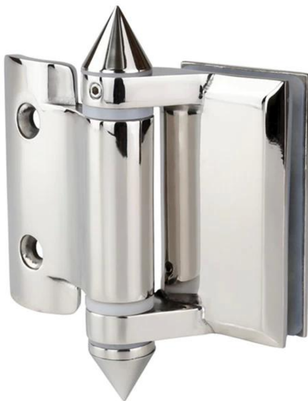
Glas op muurscharnier