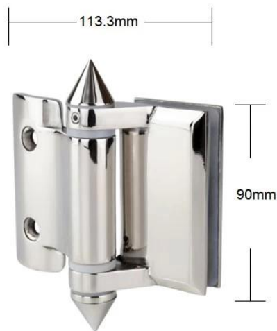
Part # G-R