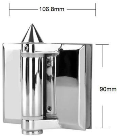
Part # G-G

Spring can be adjusted for closing speed control .