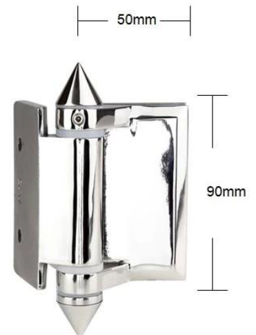
Part # G-W