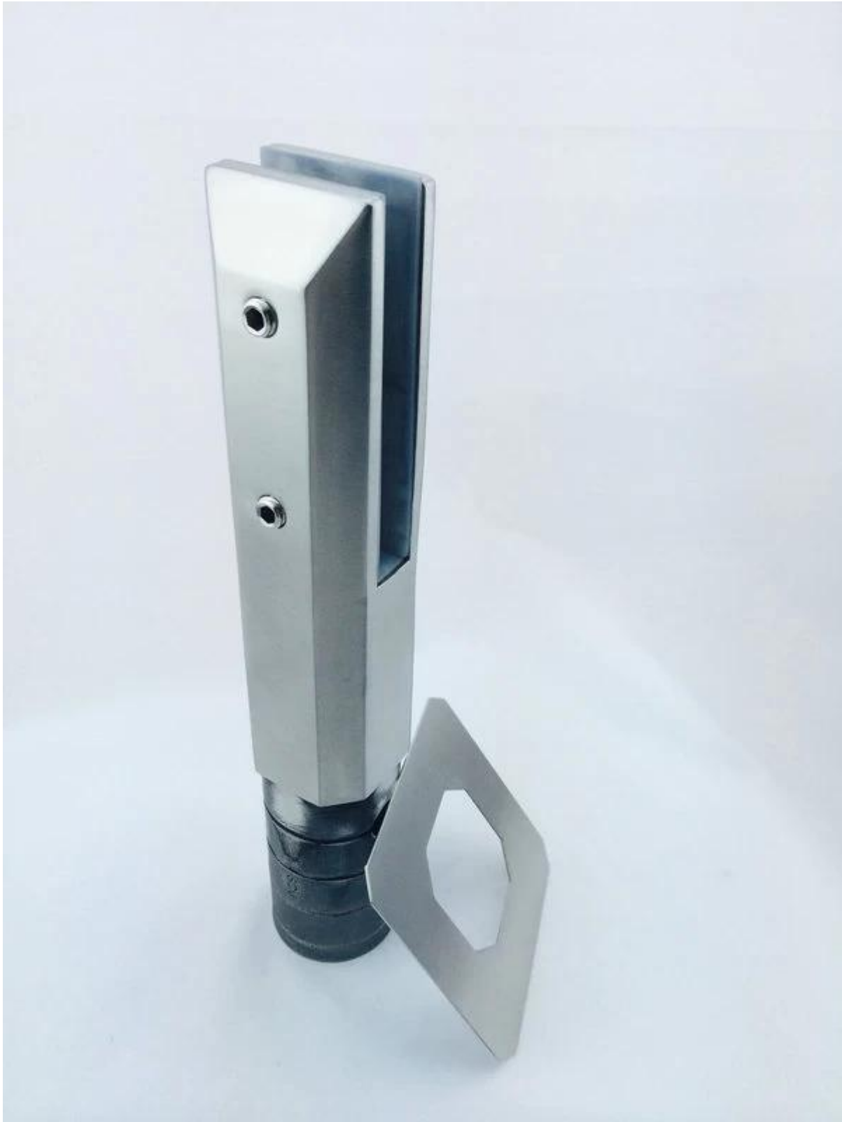
Plein en rond kernboor spon met mirror gepolijst, heldere oppervlakte;