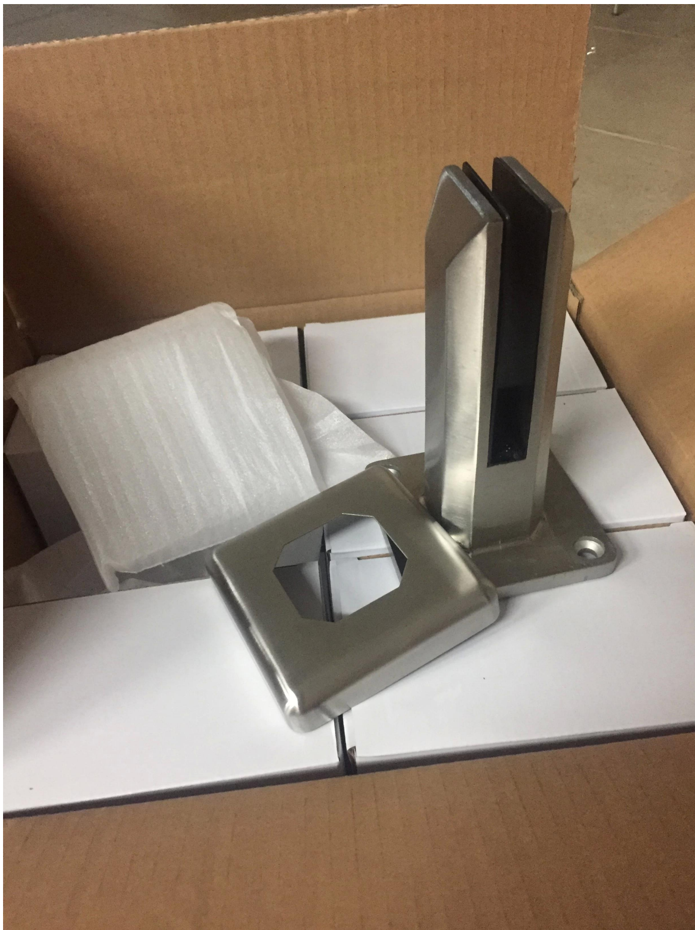
installatie foto zonder leuning