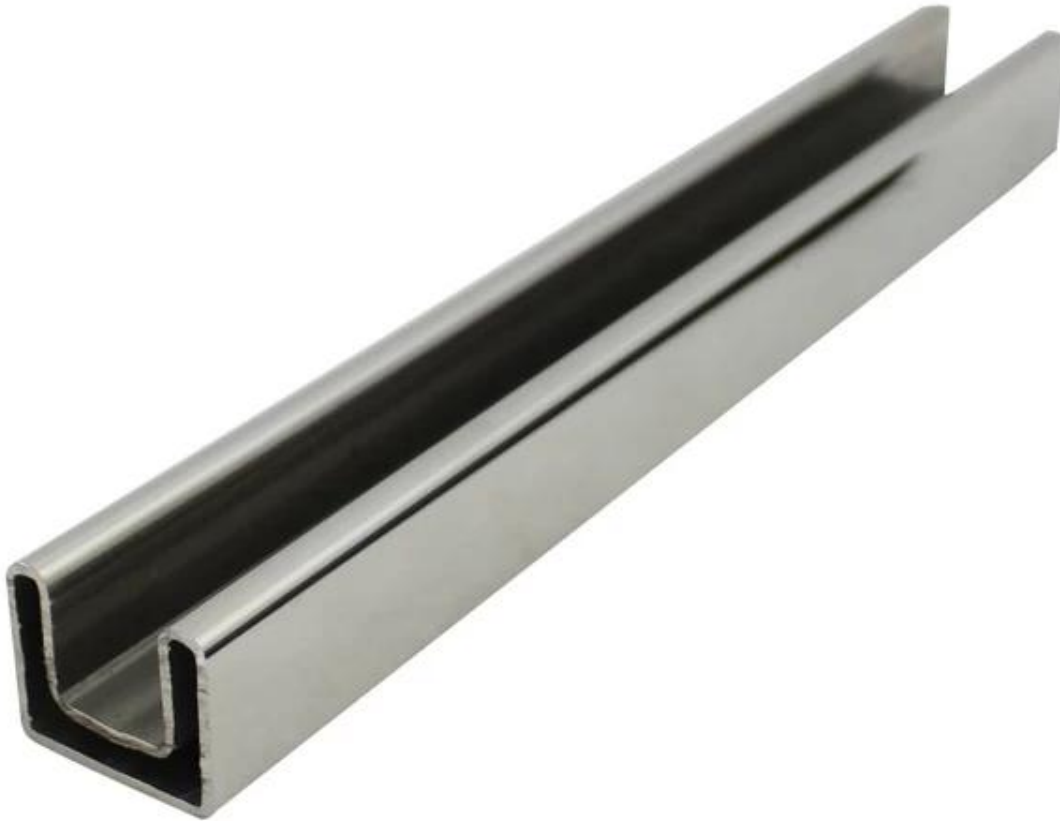
Vierkante glazen balustrade vorm roestvrij staal top rails kanaal buis leuning en hulpstukken foto,