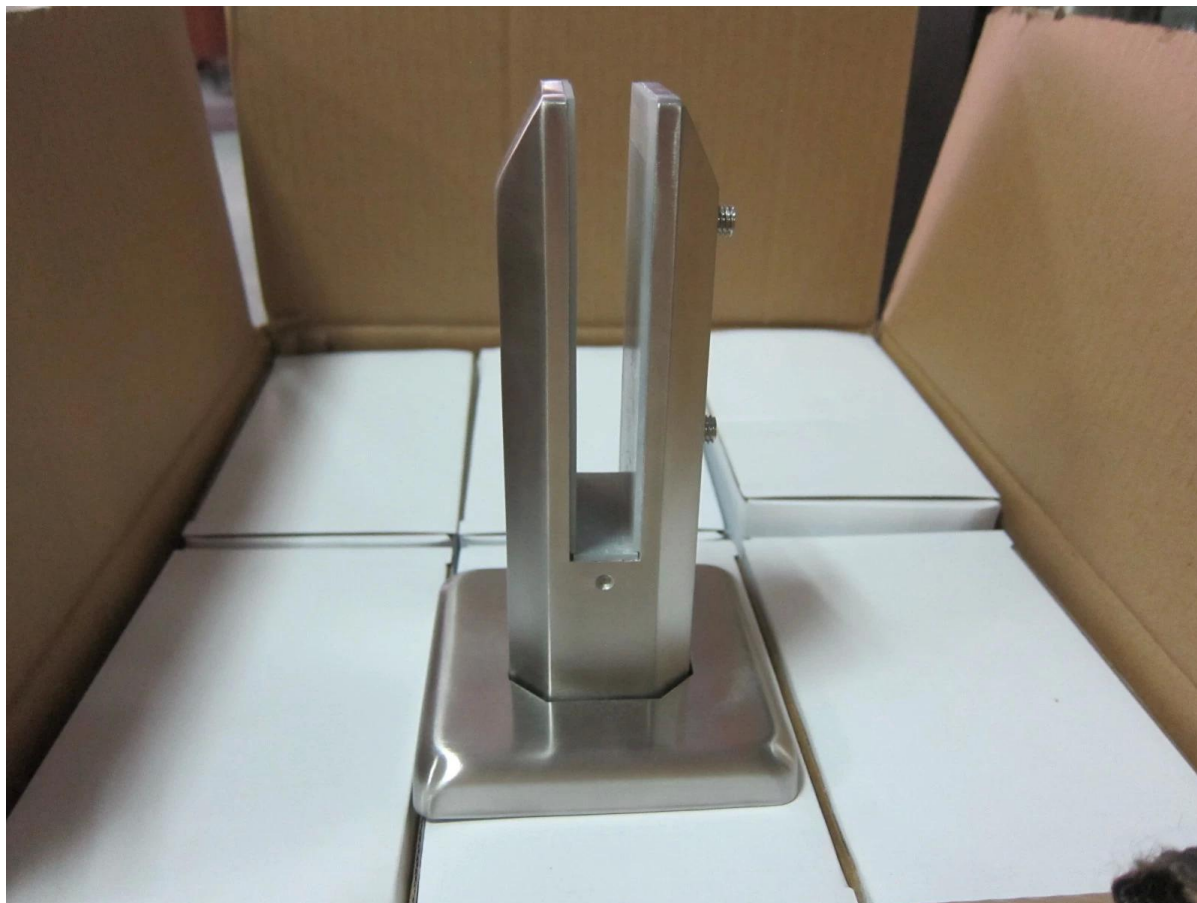
3. roestvrij staal frameleze glazen balustrade spon project foto's,