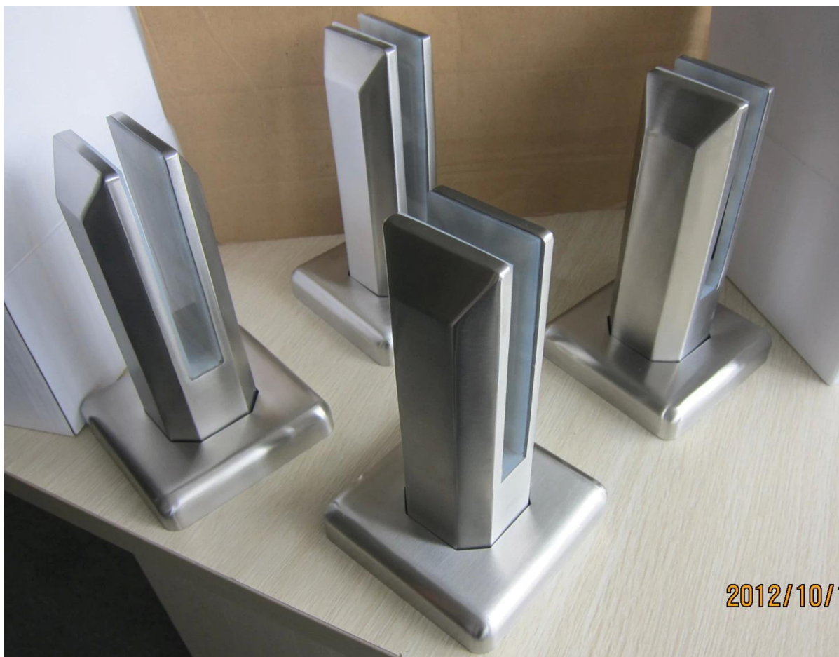
Rond kernboor zwembad hek spigot model. RCM