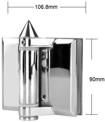
Part # G-G

Spring can be adjusted for closing speed control .