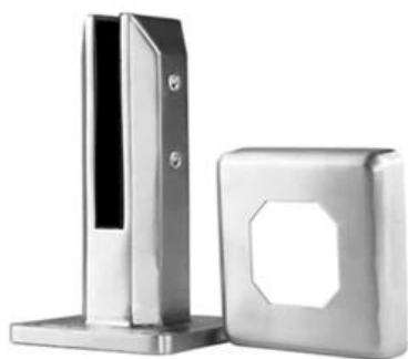
MODEL # SBM