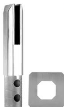
MODEL # SCM