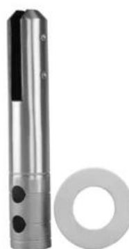
MODEL # RCM