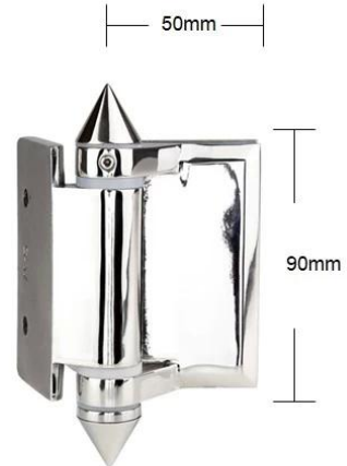
Part # G-W