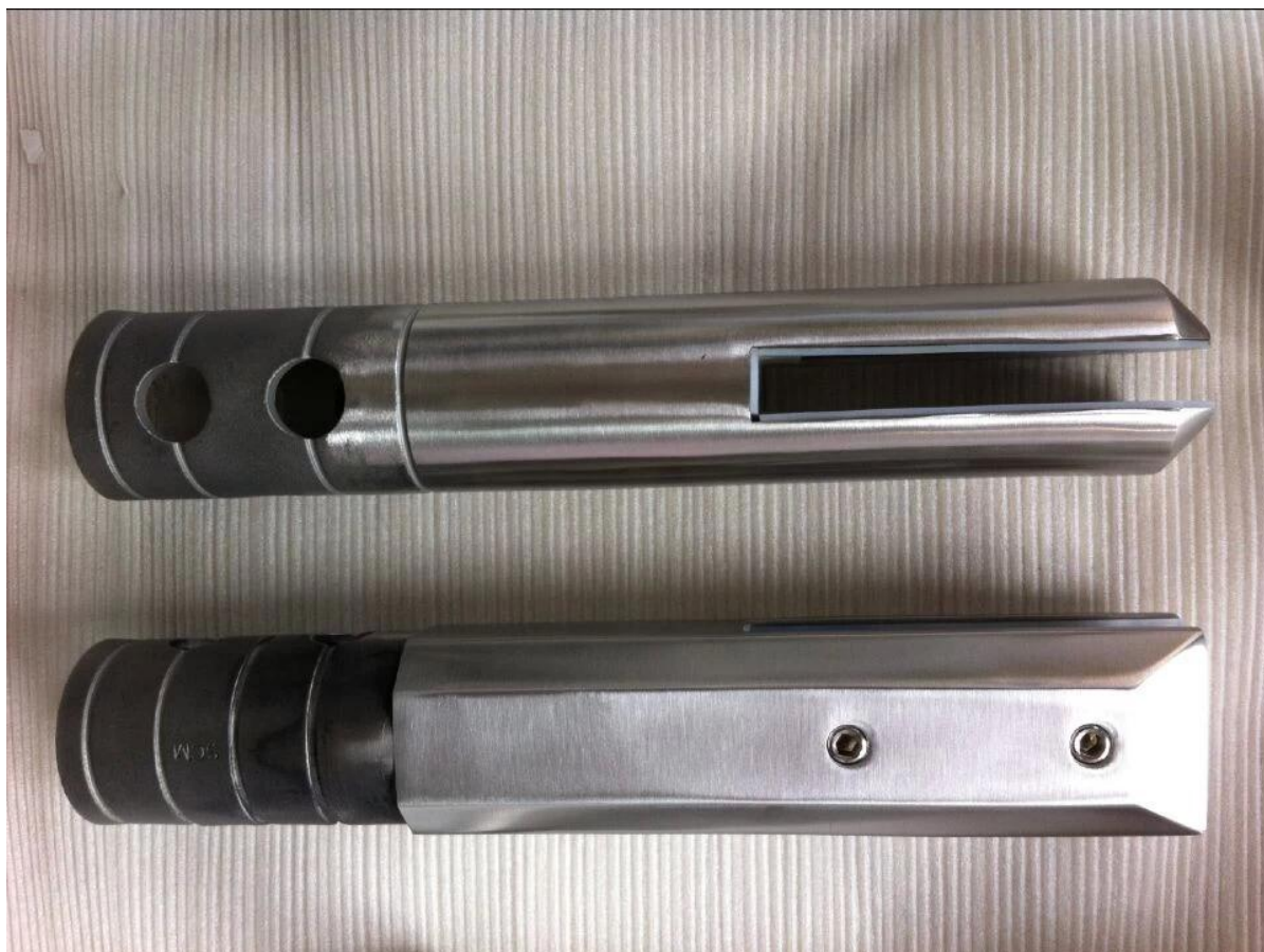
4.glass scharnier en grendel voor glazen deur ook beschikbaar RVS 316 soft close zwembad scharnier fabriek van China, roestvrijstalen frameloze glazen zwembad scharnier australische standaard