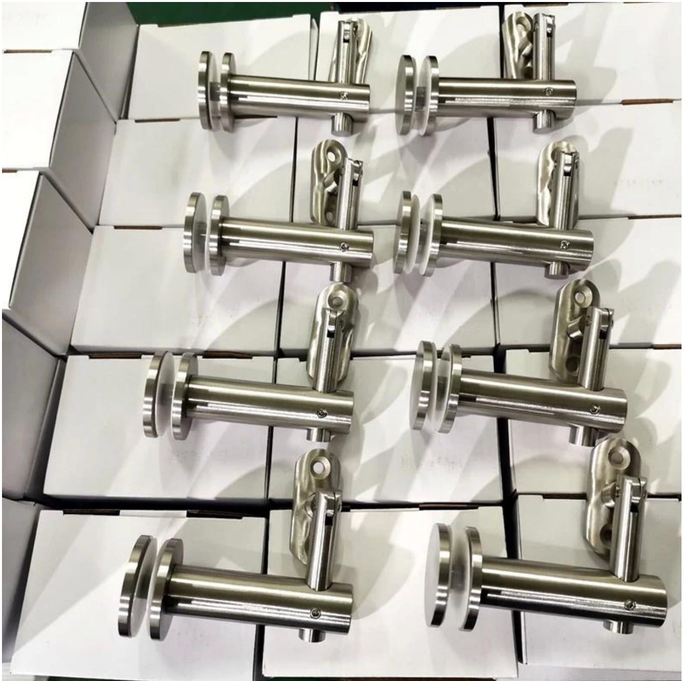
Glazen leuning projectfoto's -