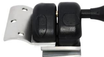
MODEL # GL-R

-Projectfoto's van glazen zwembadafrastering met scharnier, grendel, spigothardwares-