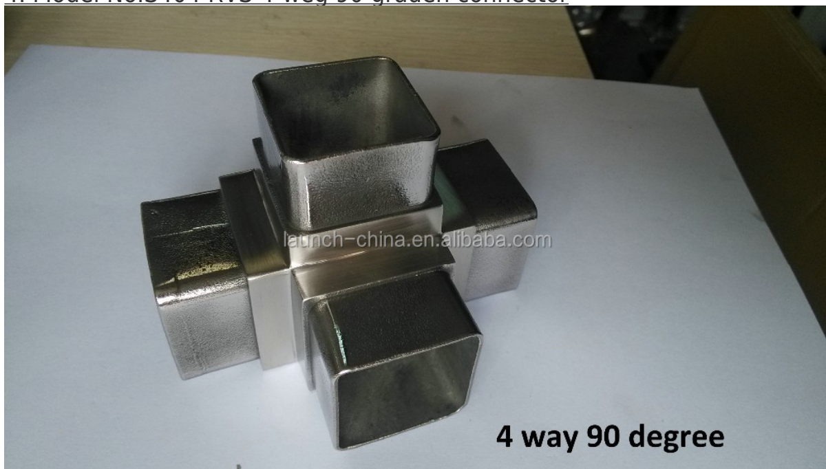
4 way 90 degree