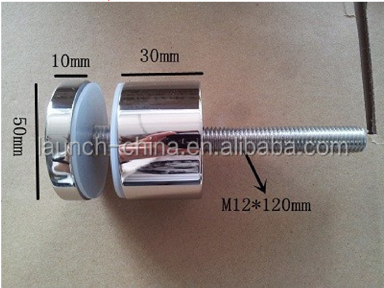
3. Model No. SF-50T impasse.