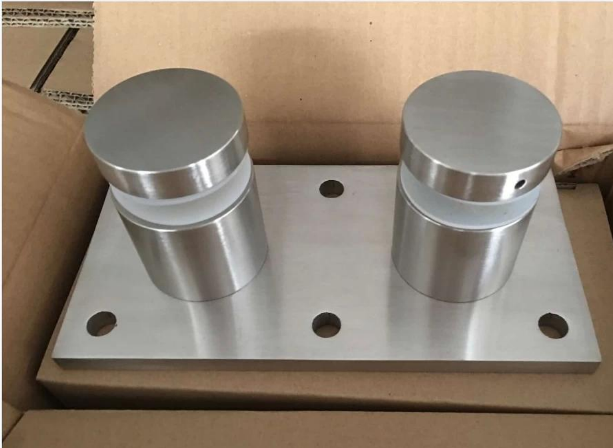
2. RVS standoff montage frameless glazen trapeuning modern ontwerp foto 's