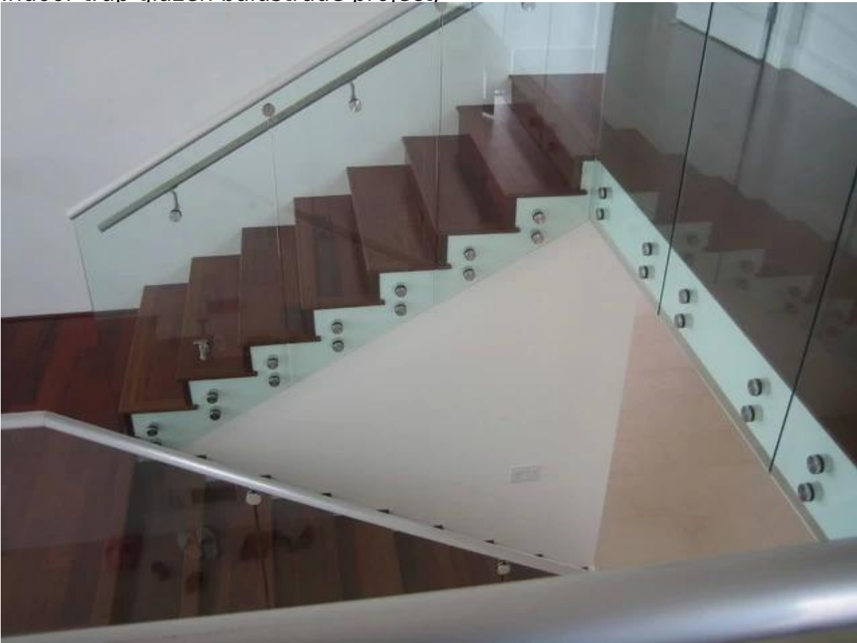
4. glazen balustrade Model No.SF-50T :