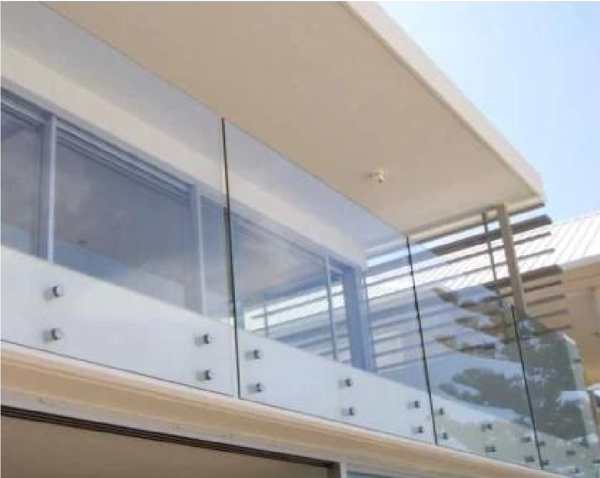
Indoor trap glazen balustrade project,