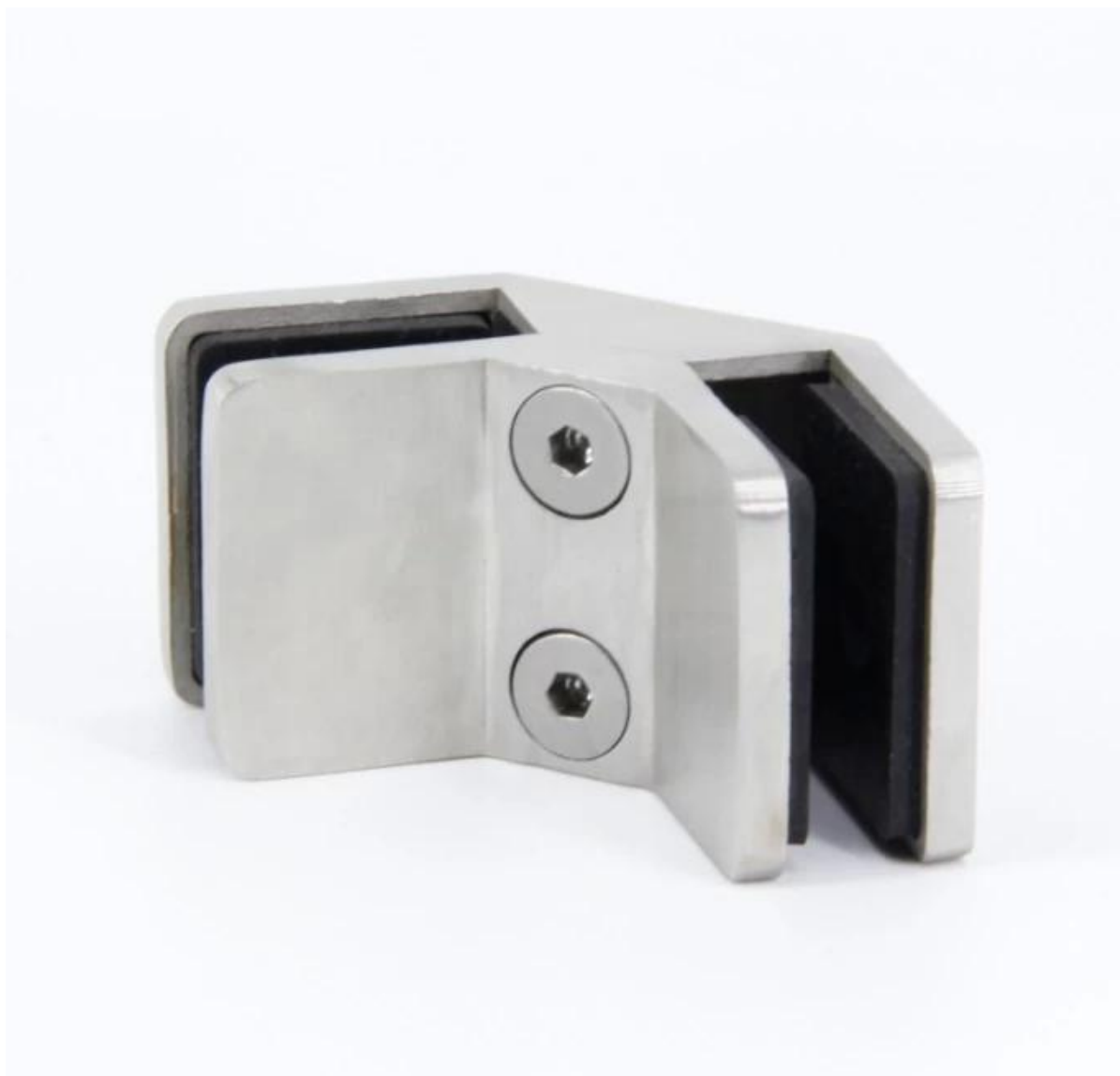
3. wymiary dla 12-15mm szkło 90 stopni szkła zacisku ze stali nierdzewnej