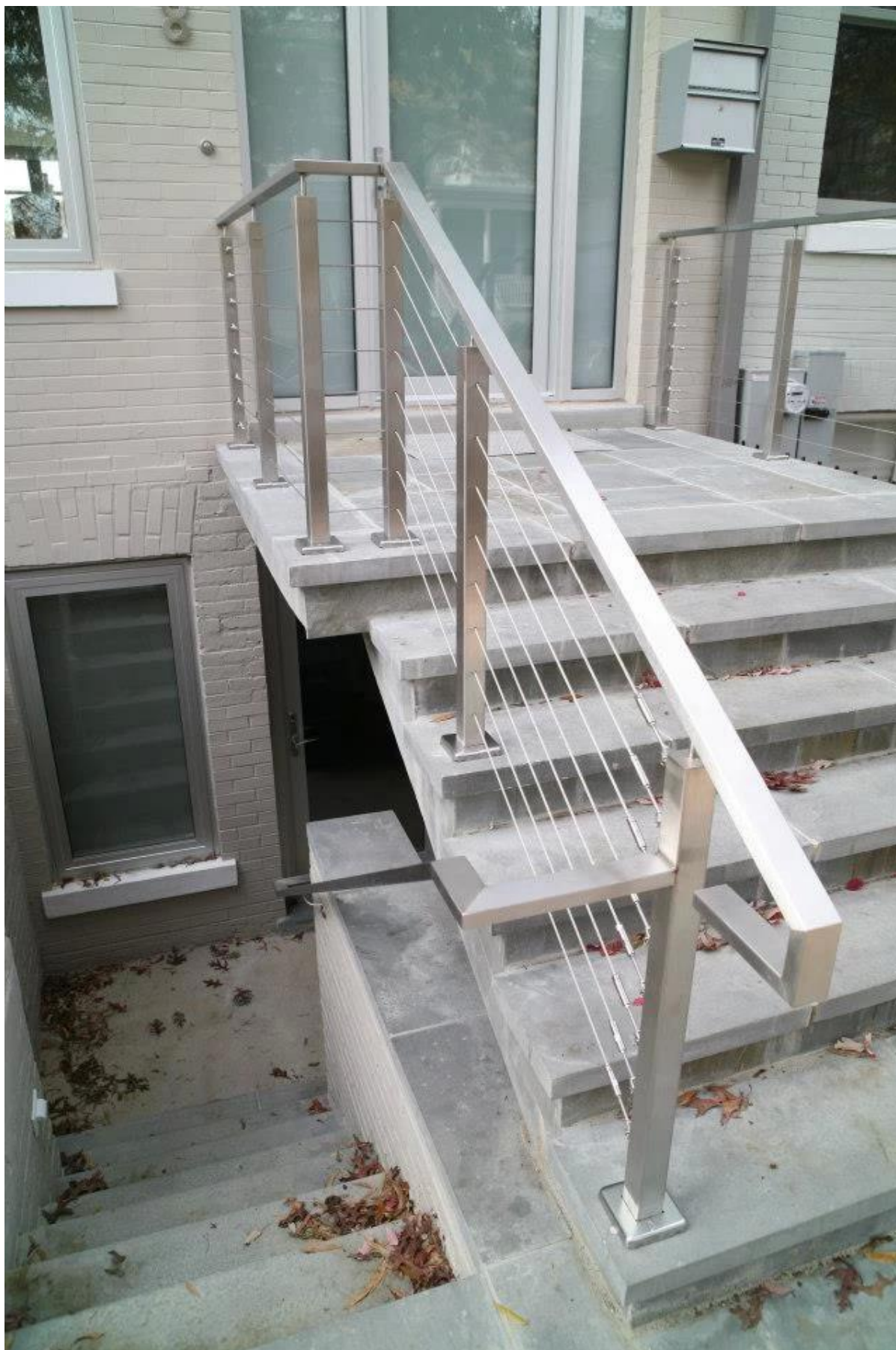
Armatura potrzebne do kwadratu linowej poręczy Plac po