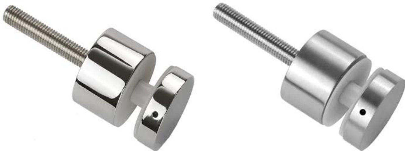
Śruba dystansowa ze stali nierdzewnej 316 do bezramowych konstrukcji balustrad balkonowych