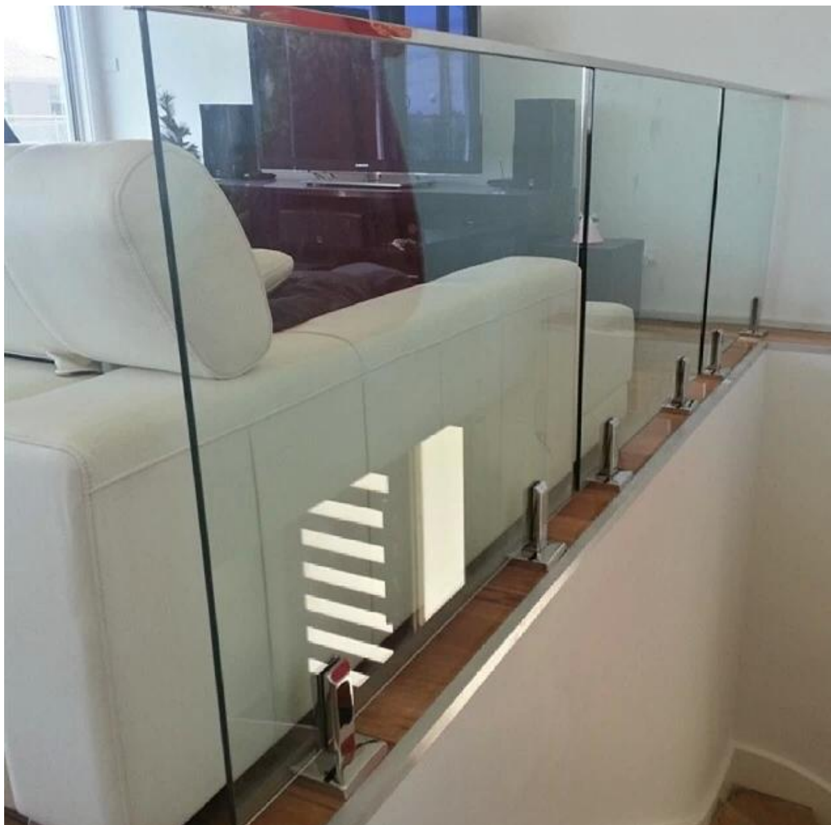
2. Balcony wzory balustrad Balustrady ze stali nierdzewnej Rura projekt gniazdo: