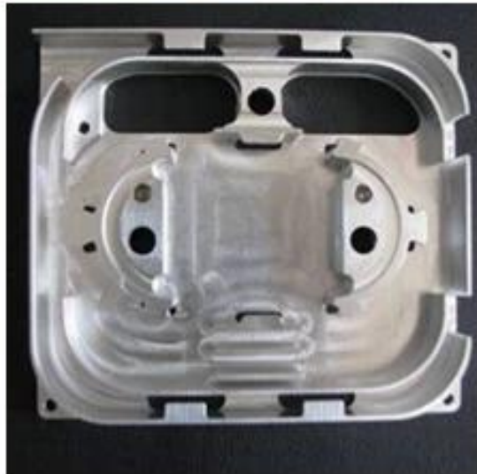
Wtrysk z tworzywa sztucznego