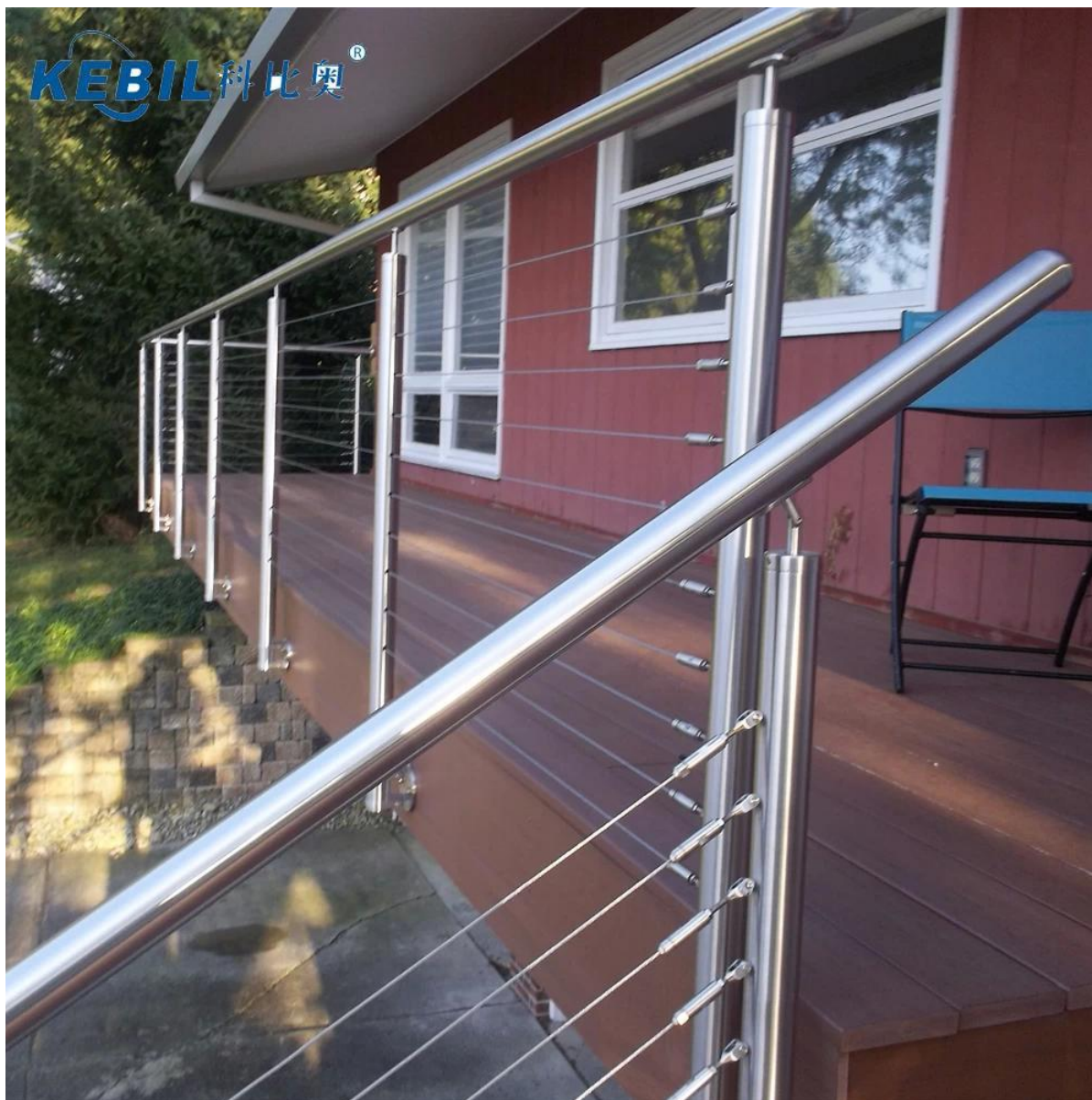
- Wewnętrzna konstrukcja klatki schodowej ze stali nierdzewnej