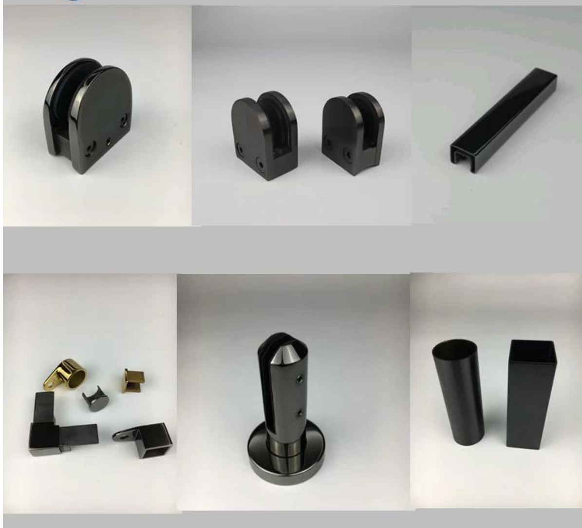
Związane z produkty - aluminium U kanał