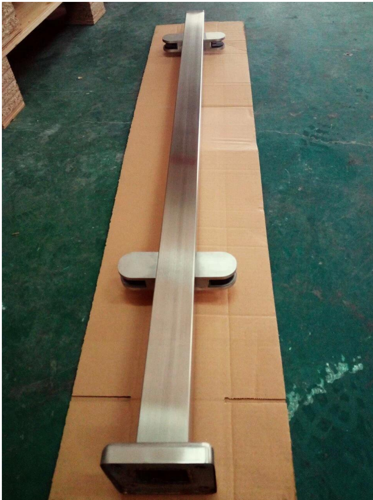
Okrągły słupek poręczy