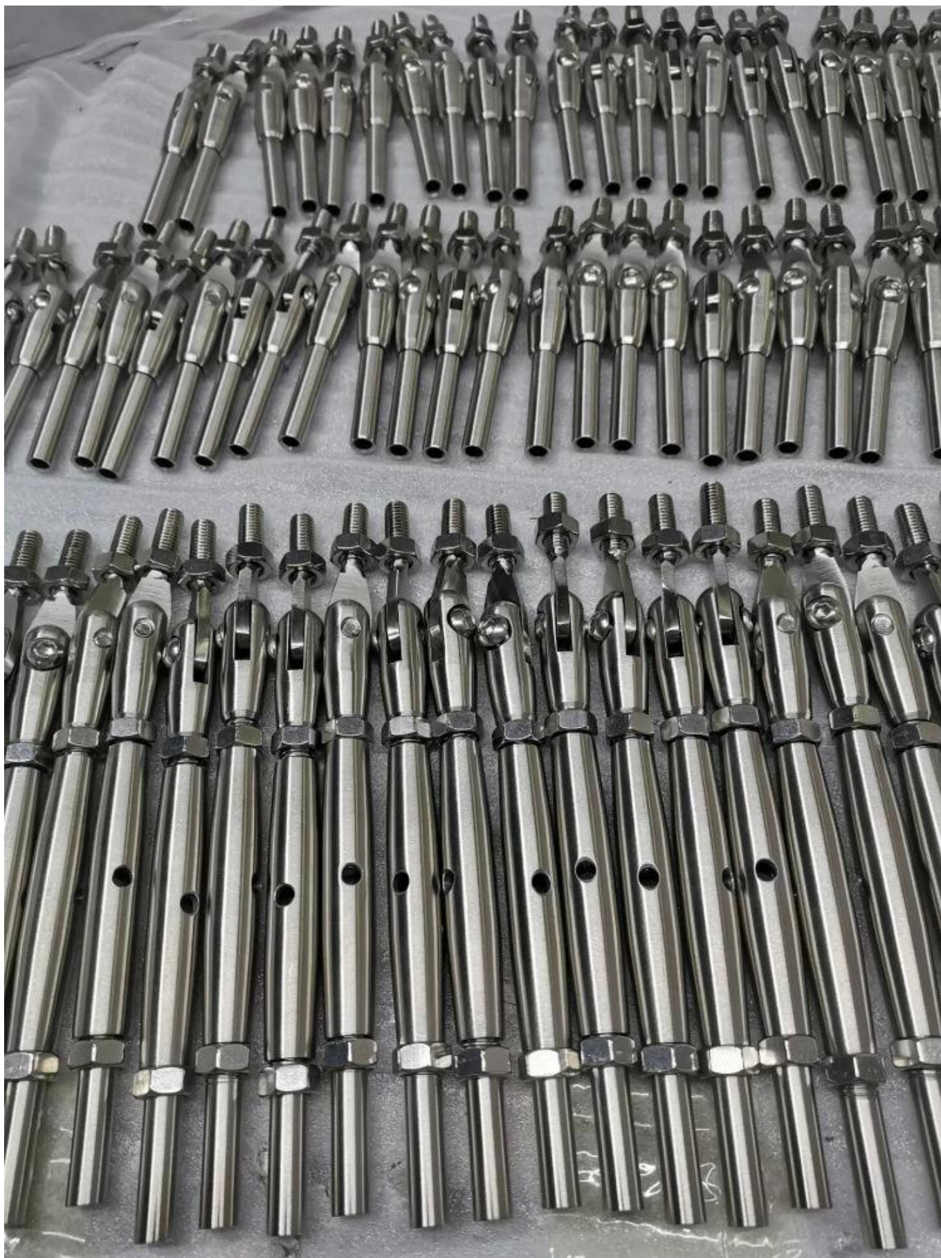
Balustrady balustrady kablowej ze szczotkowanym ze stali nierdzewnej zaciskającej napinacze kablowe 5-6 mm