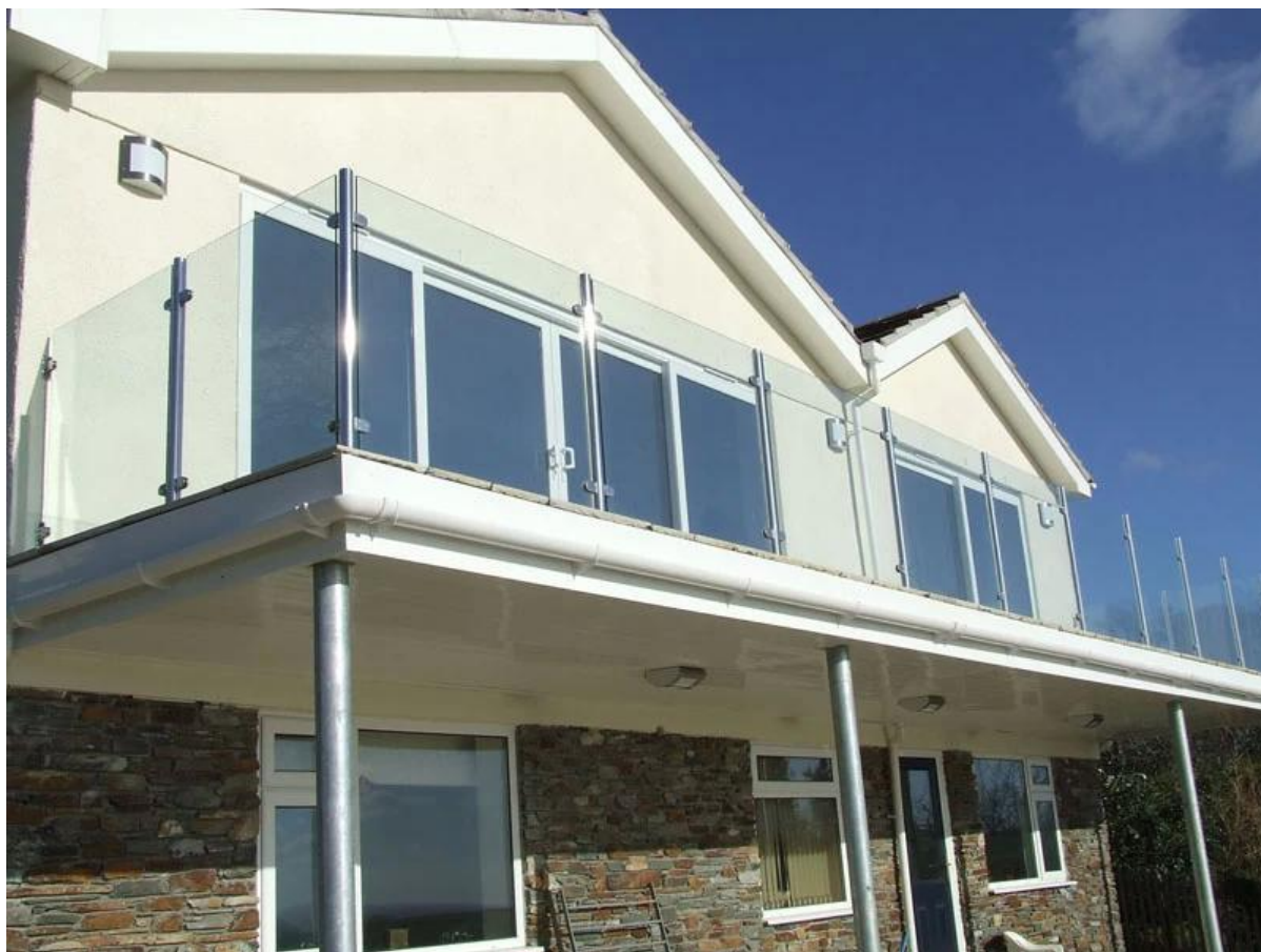
zdjęcie szklanej balustrady balkonowej.