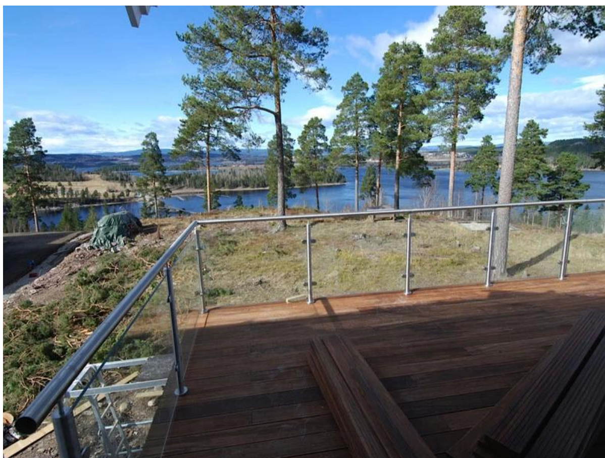
balustrady ze stali nierdzewnej ze szkłem