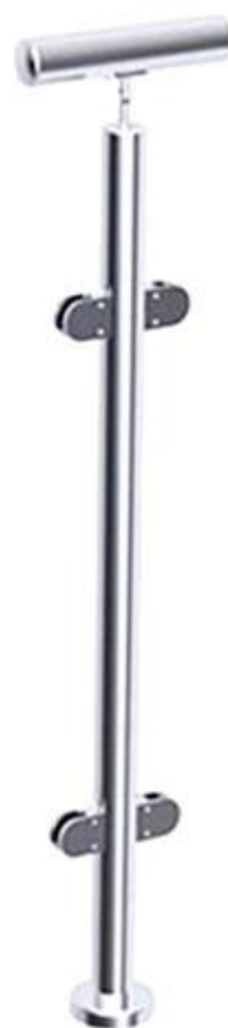
Szklany balustrada balkonowa