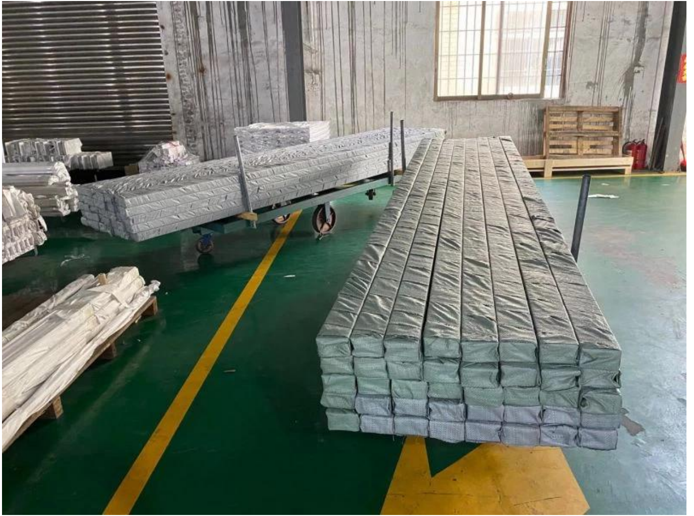
Projekt Photo Deck Aluminium U Channel Glass Railing System-