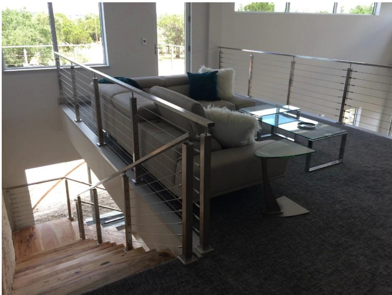
Słupki balustrady ze stali nierdzewnej wypełnione kablem z drewnianą poręczą do projektowania balustrad schodowych