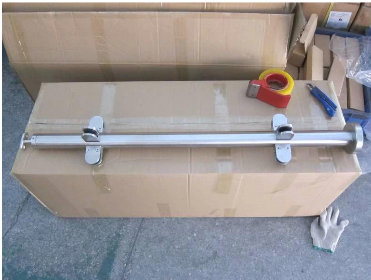
Projekt Zdjęcia szklanego koloru złotego stali nierdzewnej Balkon Balkon-