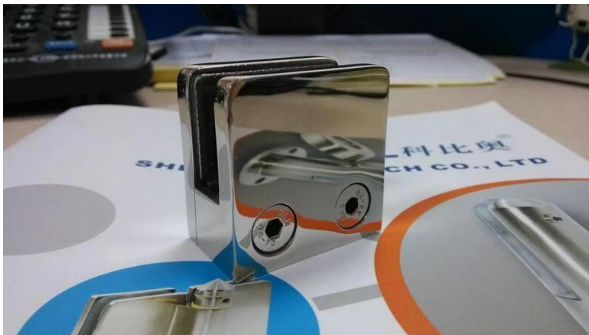
Projekt Zainstalowany na balustrada ze stali nierdzewnej postu