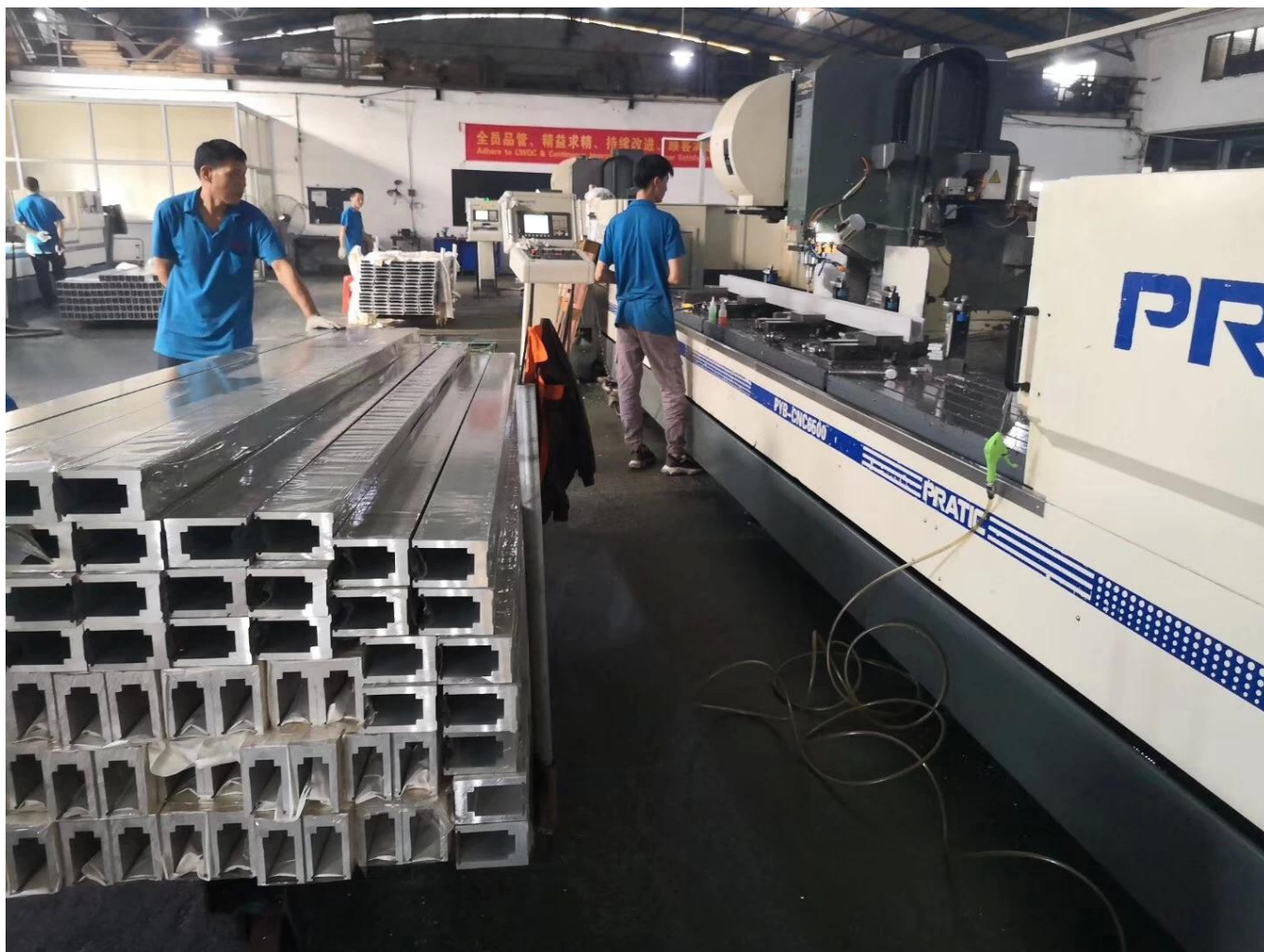
Zdjęcia projektu Aluminium U Channel Glass Railing Balustrady-