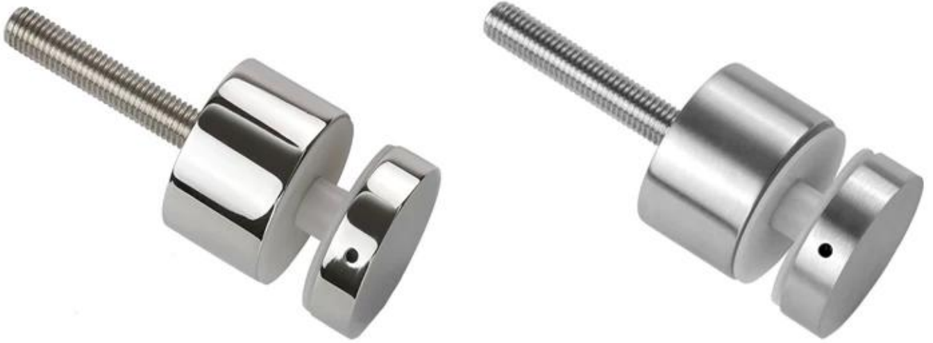
Stanik ze stali nierdzewnej w kolorze srebrnym Do montażu na drewnianym podłożu: