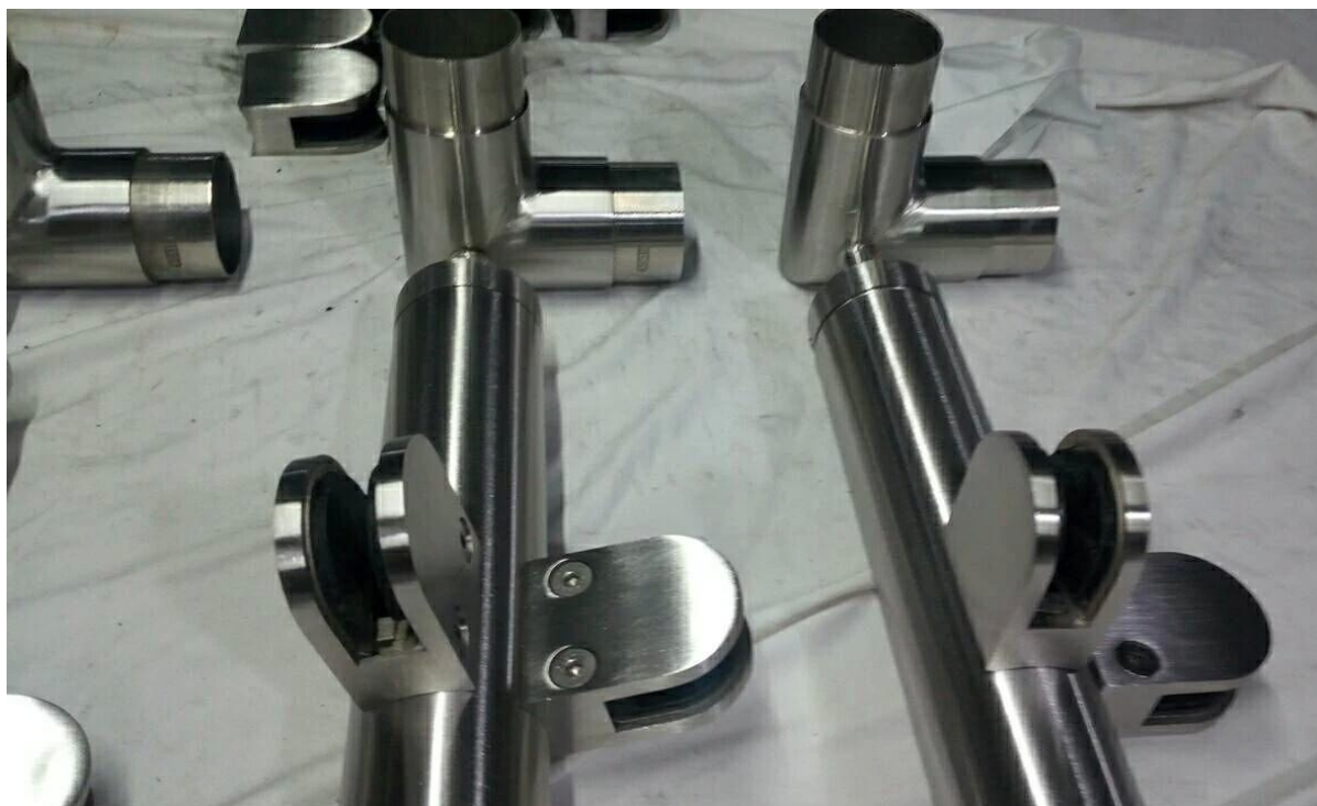
Poręcz balustrada szklana z nakładką na górze.