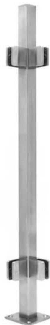
8-12mm Grubość Wyczyść szkło hartowane -