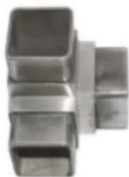
3-way tube connector