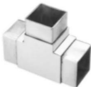
3-way tube connector