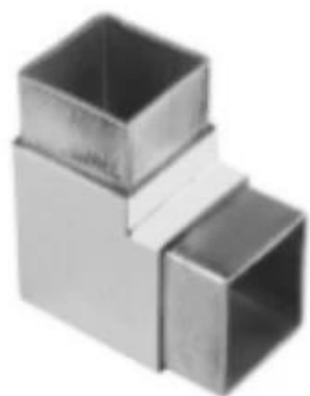
2-way tube connector