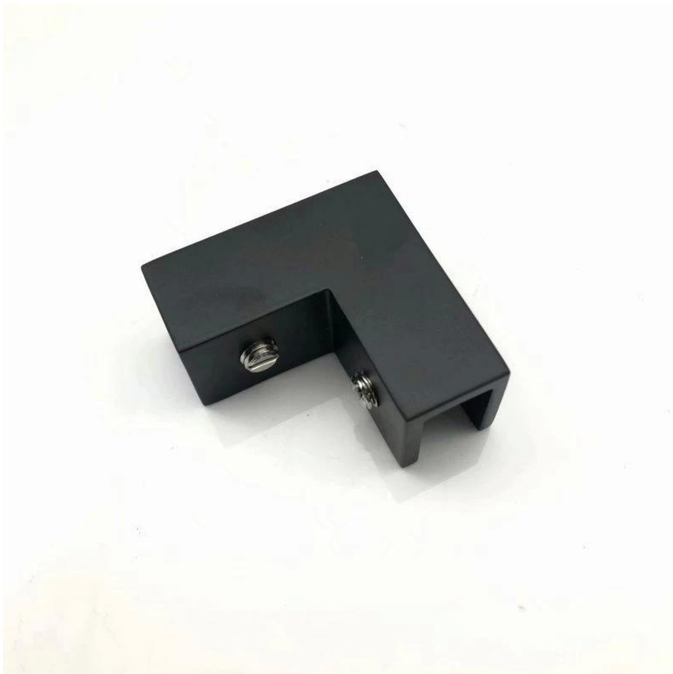
90-stopniowy szklany zacisk narożny w satynowym, lustrzanym i matowym czarnym wykończeniu: