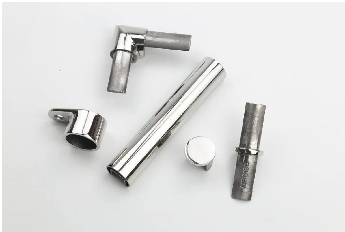
Wyświetlaj zdjęcia za pomocą szyn nasadowych 21 * 25 * 1,2 mm