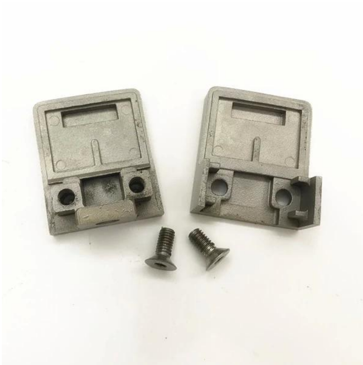
Powlekanie proszku białej koloru zacisku szkła