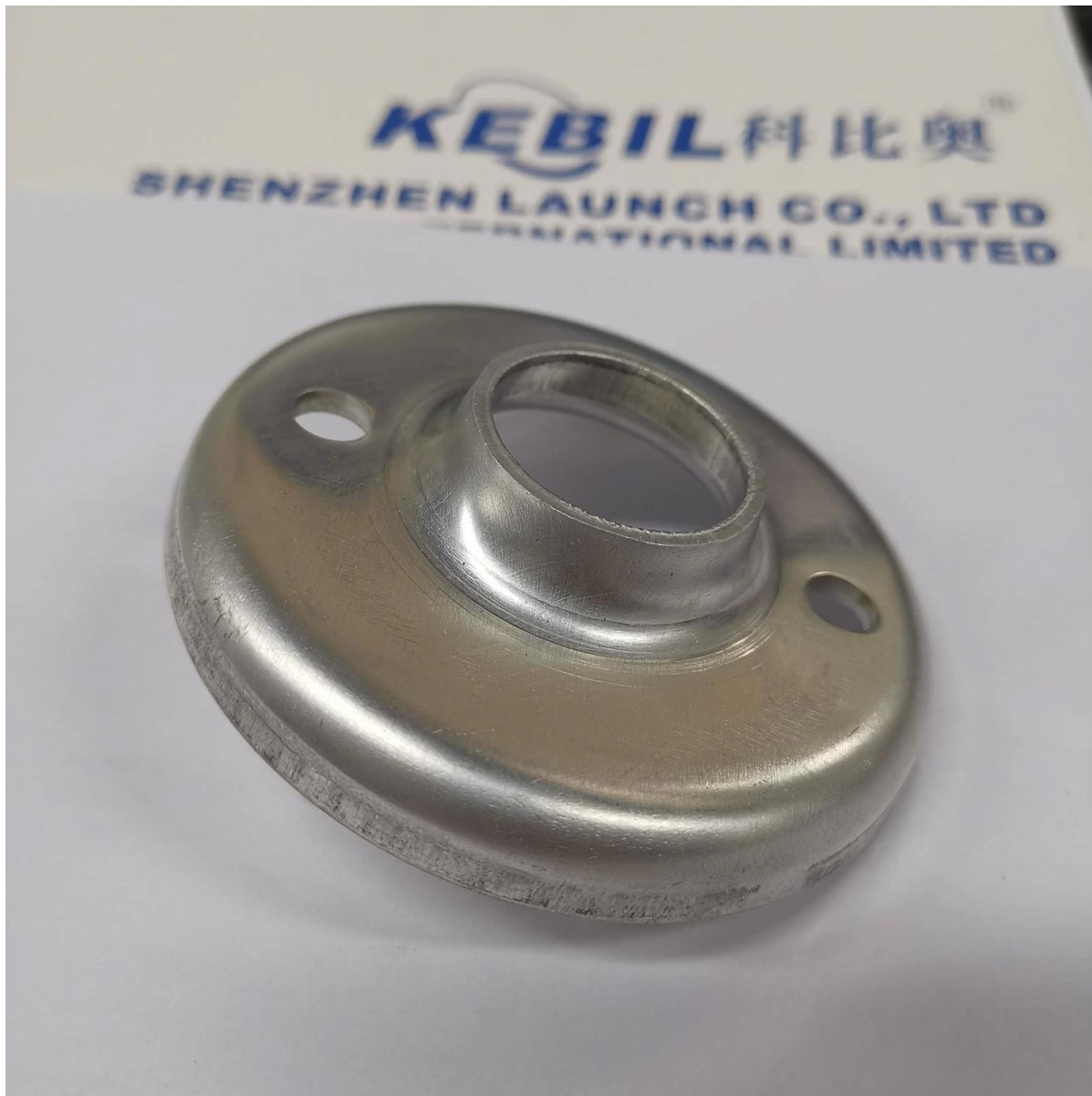
Tłoczenie niestandardowych części zamiennych OEM