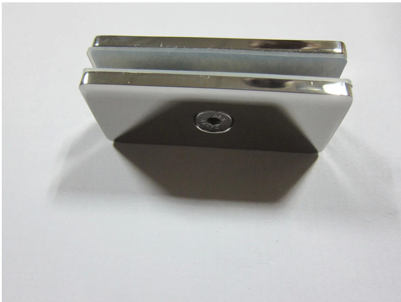
Pakowanie zdjęć do zacisku szklanego 180 stopni