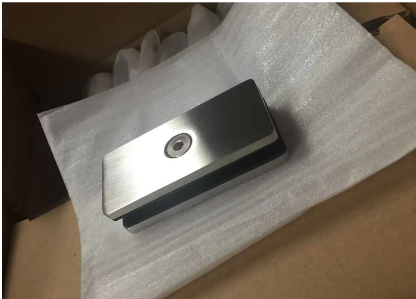
Zdjęcia projektowe do zacisku szklanego 180 stopni